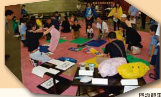
博物館実習生による防災講座の運営