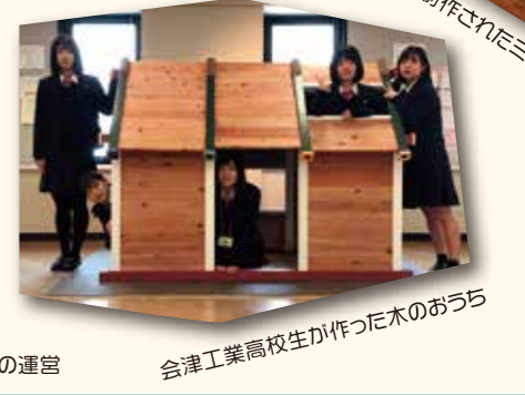
会津工業高校生が作った木のおうち