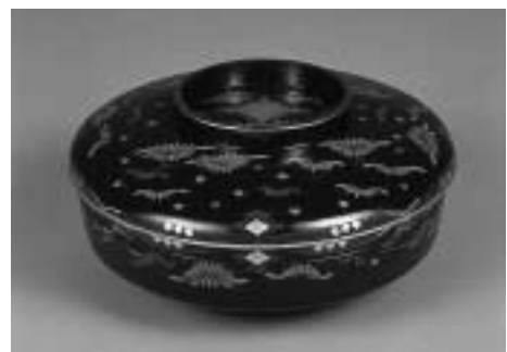
青光塗菊漆絵大平