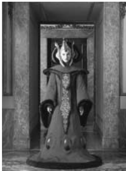
アミダラの王座の間のガウン(コスチューム)