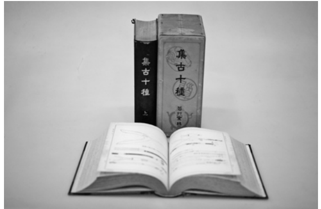
写真4 『集古十種』芸艸堂本