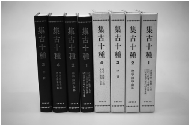
写真5 『集古十種』名著普及会本