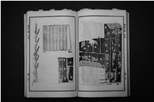
写真7 『集古十種』郁文舎本レイアウト