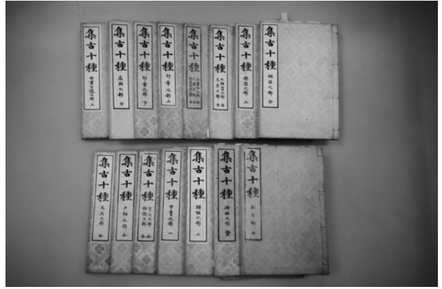
写真2 『集古十種』郁文舎本