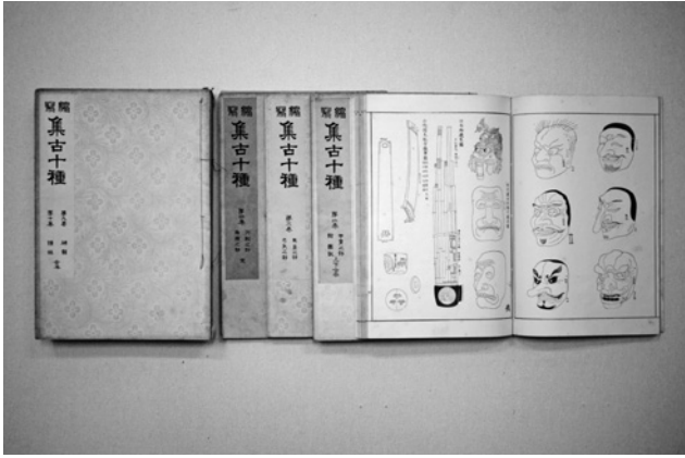
写真1 『集古十種』東陽堂本