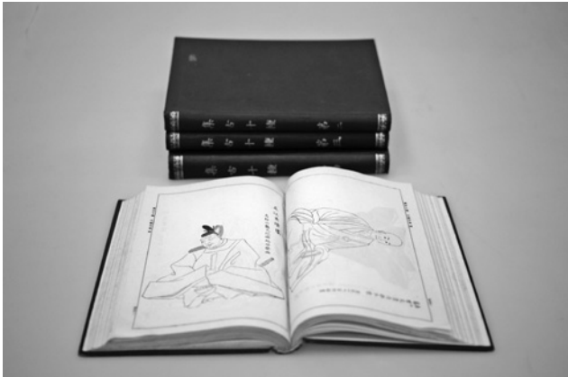
写真3 『集古十種』国書刊行会本