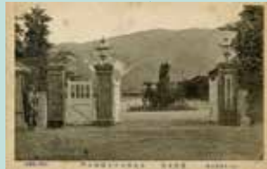
絵葉書軍隊生活歩兵第六十五連隊正門