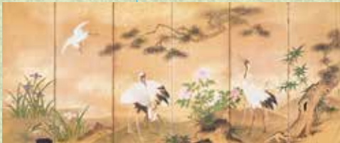
竹内澤興 花鳥図屏風 当館蔵 (伊藤豊松コレクション)

雪舟を慕い学んだ会津藩お抱え絵師加藤遠澤。澤の字を受け継ぐ遠澤の弟子たち。狩野探幽に発する江戸狩野の影響濃厚な会津藩お抱え絵師の永峰家。強烈な個性の町絵師・萩原盤山。江戸画壇の大御所・谷文晁に学んだ佐竹永海、遠藤香村。会津ゆかりの絵画をオールスターキャストでおおくりします。