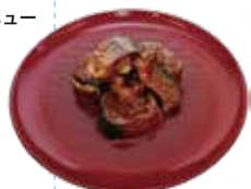
棒たら煮再現制作 当館蔵

ふくしまの食文化 12月13日(土)~2026年3月1日(日) 三の丸Aベニュー