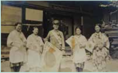
出征記念写真

アジア・太平洋戦争が終戦してから80年。福島県民や県出身者が体験した戦争を振り返る展覧会です。軍人が家族に送った軍事郵便や写真、実際に身につけた軍服を始めとする関係資料をご紹介します。あわせて近代の会津若松と若松連隊の歩みも取り上げ、軍隊と地域の関係にもスポットをあてます。