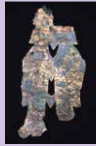
真野20号墳出土金銅製双魚佩 当館蔵(福島県指定文化財)

ふくしまの発掘調査成果をご紹介してきた「発掘ふくしま」シリーズ。今回は、ふくしま発掘の原点に迫ります。江戸時代には文化人が考古資料を集め、明治・大正時代には各地で発掘が行われました。人々はなぜ発掘をして、資料を集めたのでしょうか。出土資料や残された記録を通して、ふくしまの発掘に携わった人々の思いに触れます。