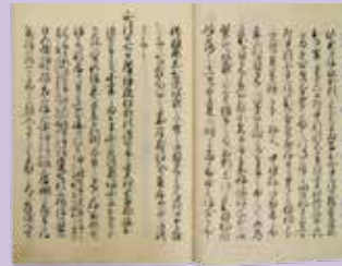
家実実紀 松野千光寺跡の経筒発見の記事(部分)