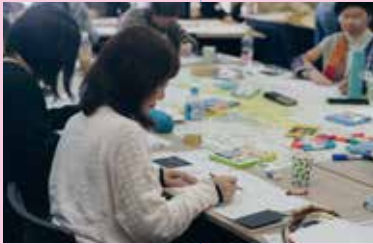
ワークショップ「魅力の予感」より 講師:きむらとしろうじん(美術家/陶芸家)