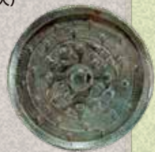
会津大塚山古墳出土三角縁神獣鏡 会津若松市蔵・当館寄託(国指定重要文化財)

東北地方で唯一の「三角縁神獣鏡」をはじめとする、会津大塚山古墳の豊富な出土遺物が一堂に並びます。日本古代史上で重要な会津大塚山古墳とはどんな古墳なのか、わかりやすく紹介します。