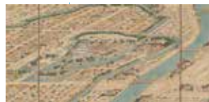
若松城下絵図屏風(部分) 当館蔵

若松城下絵図屏風を見る 9月17日(水)~10月13日(月・祝) 総合展示室 近世