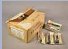
避難所に残されたスティックパン 当館蔵

東北地方太平洋沖地震の発生から15年を迎えます。いつどこで起きても不思議ではない災害への「そなえ」について、大切な人と考えるきっかけとなることを目指します。今までに収集した震災遺産を振り返り、東日本大震災を知らない世代のみなさんとも「ふくしまの経験」を共有し、「未来のふくしま」について考えてみませんか。