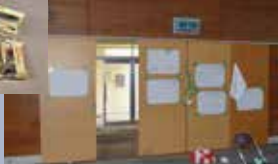
避難所に残された貼り紙(収集時の様子) 浪江町