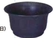
銅鉢 八槻都々古別神社蔵・当館寄託(国指定重要文化財)

若松城下の商人たちー大町検断築田氏の記録からー 11月29日(土)~12月26日(金) 総合展示室 近世