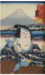
原 貞徳屋重兵衛 (東海道五十三次のうち) 当館蔵

新収蔵資料展ー葉たばこ財団寄贈資料ー 4月1日(火)~6月29日(日) 三の丸Aベニュー