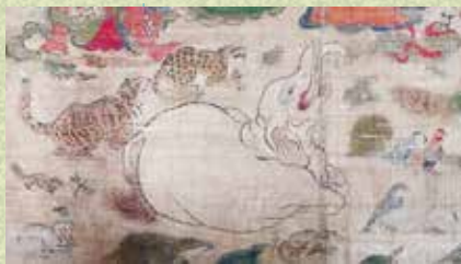
涅槃図(部分) 相馬妙見歡喜寺蔵・当館寄託

身近な動物、聖なる動物、幸いをもたらす動物……祈りの造形の中には、さまざまな動物が表されています。動物たちの姿をご紹介します、そこに込められた意味や祈りを探ります。