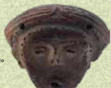
荒屋敷遺跡出土漆塗土偶 三島町蔵・当館寄託(国指定重要文化財)

国の重要文化財に指定されている荒屋敷遺跡の出土品。土器や石器・木製品などの貴重な資料をもとに、縄文時代の人々のくらしとものづくりについて考えます。