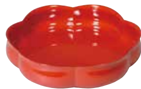
増村益城<<乾漆朱輪花盤>> 昭和58年 文化庁蔵

平成三十年度秋の企画展 「日本のわざと美」展―重要無形文化財とそれを支える人々―