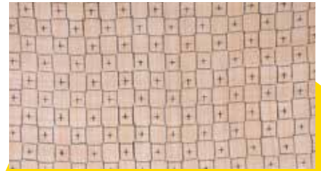
喜如嘉の芭蕉布保存会《芭蕉布着尺「ハチジョーハチ」》 平成25年 文化庁蔵