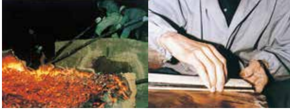
木原明《玉鋼》 熊本県立装飾古墳館蔵