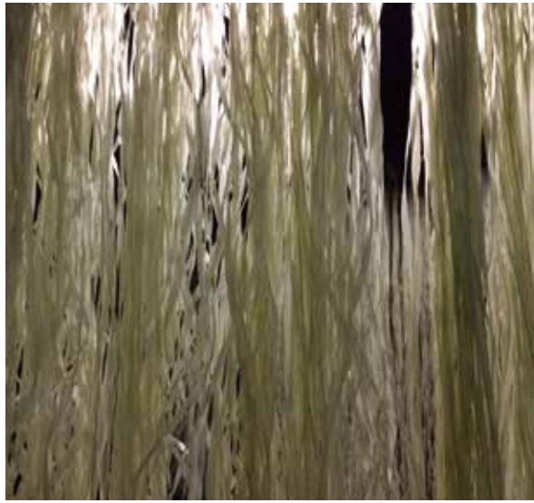
昭和村からむし生産技術保存協会《からむし》 昭和村からむし生産技術保存協会蔵