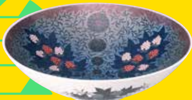
十三代 今泉今右衛門<<色絵吹重ね珠樹草花文鉢>> 平成13年 文化庁蔵