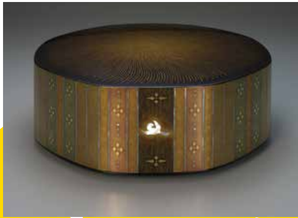
室瀬和美《時給螺鈿八稜箱「彩光」》平成12年 文化庁蔵