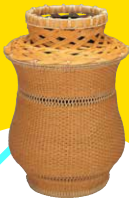
飯塚小疋齋<<松葉編白錆花籃「白龍」>> 平成4年 文化庁蔵