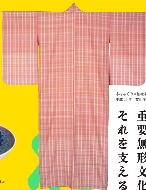
志村ふくみ<<袖織中振「撫げし」>> 平成22年 文化庁蔵