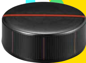
山岸一男<<沈黒象嵌合子「能登残照」>>平成28年 東京国立近代美術館蔵