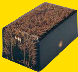
松田権六<<蒔絵竹林文箱>> 昭和40年 東京国立近代美術館蔵