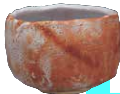
荒川豊蔵<<志野茶碗>> 昭和27年 東京国立近代美術館蔵