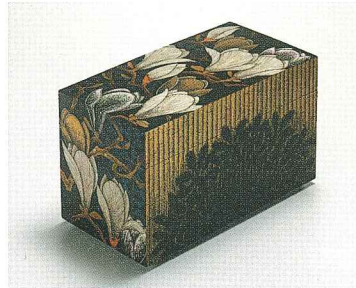
木蓮蒔絵飾箱 (個人蔵)