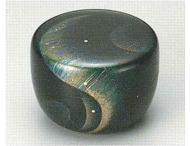
蒔絵平素 宇宙の神秘 (個人蔵)