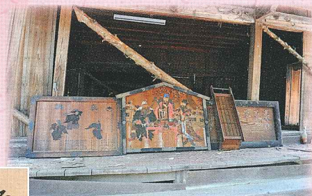
須賀川市朝日稲荷神社の絵馬