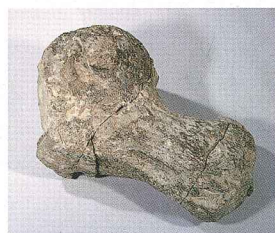
● フタバクジラ左上腕骨