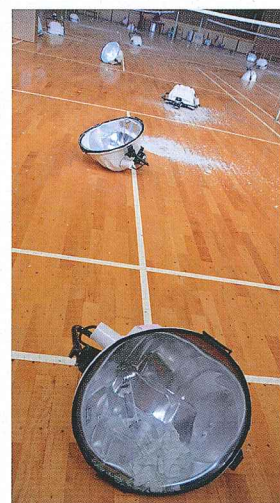
● 震災により落下した照明 (県立富岡高校)