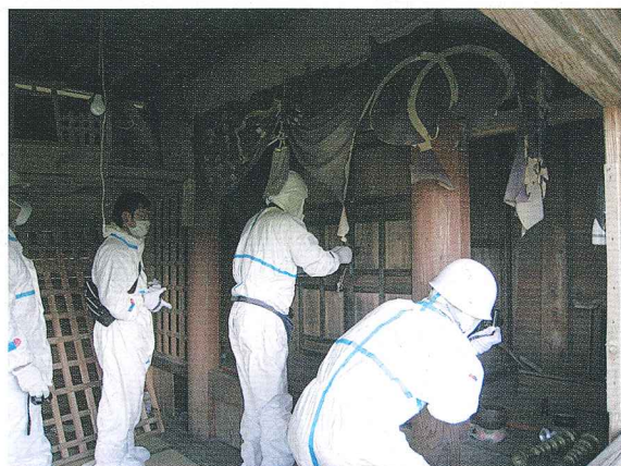
● 文化財レスキューのようす