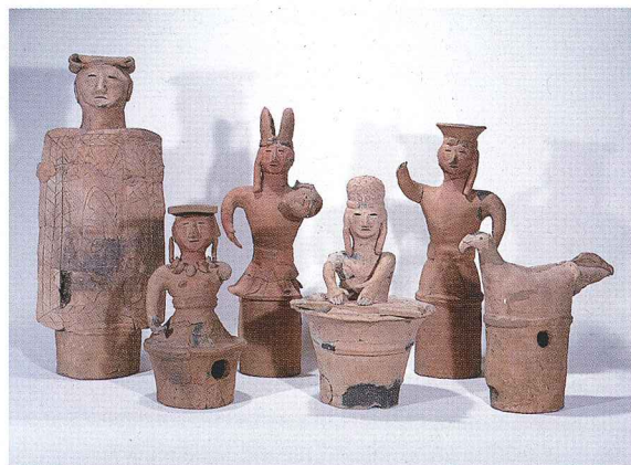
● 原山1号墳出土埴輪