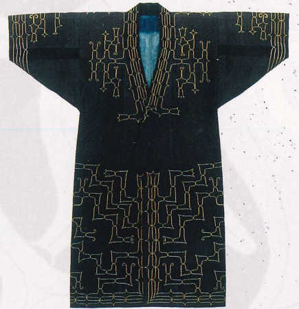
チドリ 衣服 (木綿) 青森市教育委員会蔵