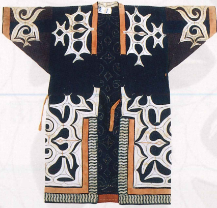
カバラミア 衣服 (木綿) 青森市教育委員会蔵