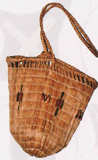
サラニア 編み袋 青森市教育委員会蔵