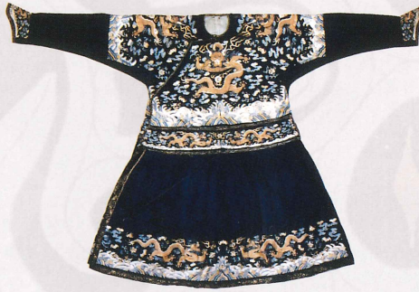
蝦夷錦 市立函館博物館蔵