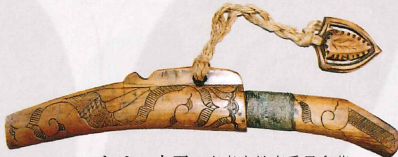
マキリ 小刀 青森市教育委員会蔵