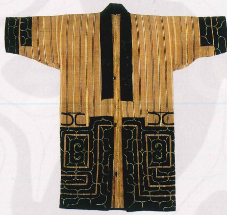
アットゥシ 衣服 (樹皮繊維) 青森市教育委員会蔵