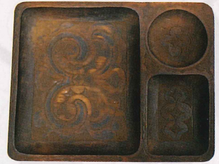
イタ 盆 東北大学大学院文学研究科蔵