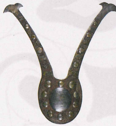
鉄先 東京国立博物館蔵