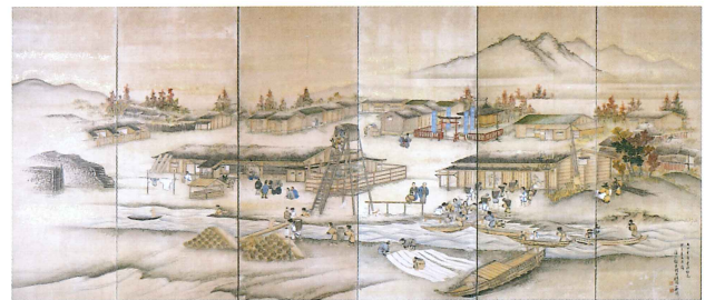
標津番屋図屏風 西巖寺蔵

会期中さまざまなイベントも予定しています。この機会に、ぜひアイヌの文化を身近に感じてください。