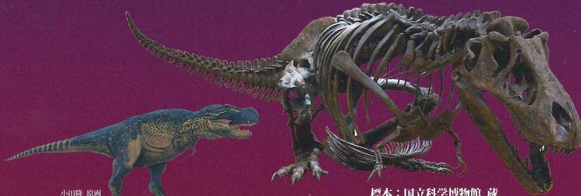
ティラノサウルス