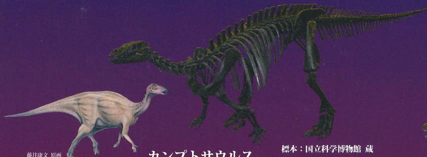
カンプトサウルス

アロサウルスも羽毛恐竜だった？ ティラノサウルスの短い前あしには、立ち上がる時に体を支える役割があった？ 今回の展示では、北アメリカ大陸からジュラ紀のアロサウルスとカンプトサウルス、白亜紀のティラノサウルスとトリケラトプスがやってきました。いずれも最新の研究成果にもとづいて復元された、迫力あるすがたです。そしてモンゴルからは、“アジアのティラノサウルス”ともいわれるタルボサウルスが！ 見どころ満載の「対決！恐竜展」。皆さまのご来館、お待ちしております！