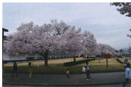
2015年 見事に花を咲かせる小彼岸桜に30年の歳月を感じる