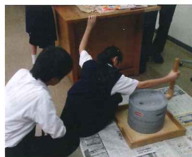
石うす体験できな粉作り

さんにも実物に触れてもらい、昔の道具の使い方や、どんな工夫があるかを調べて、いろいろなことに気付いてもらうことが目的です。