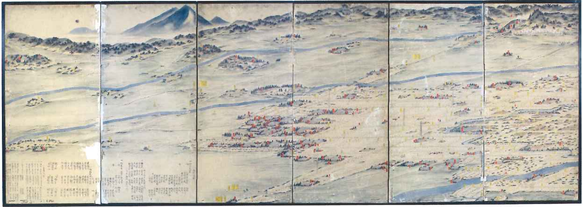
若松城下絵図屏風(しろはく古地図と城の博物館富原文庫蔵)