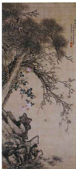
塩田牛渚「歳寒三友図」文久3年（1863）