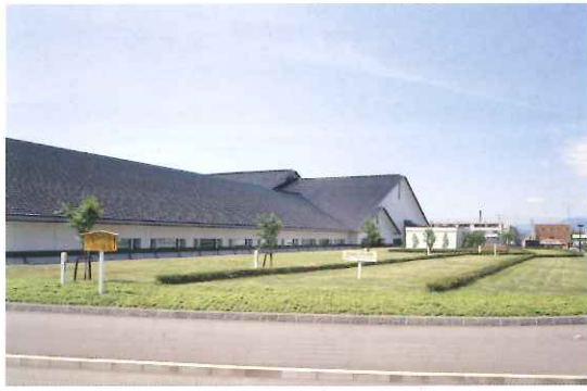
開館当初の小彼岸桜

さて、個人的にこの三十年間を振り返ると、博物館の意義を御理解いただくために無我夢中だった最初の十年間、ある程度、落ち着いて博物館の意味を考えた次の十年、社会情勢の変化、予算の削減