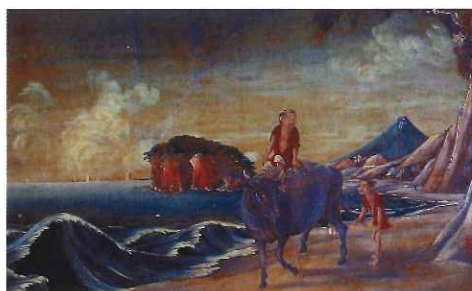
遠藤香村「七里ヶ浜図」江戸時代後期（19世紀）