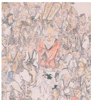
百老図(部分) 遠藤香村筆 個人蔵

また、会期中に能楽を体験する講座なども開催します。香村の作品とあわせて伝統文化を楽しみ、学ぶ機会にしたいと思っております。 (美術担当 川延安直)