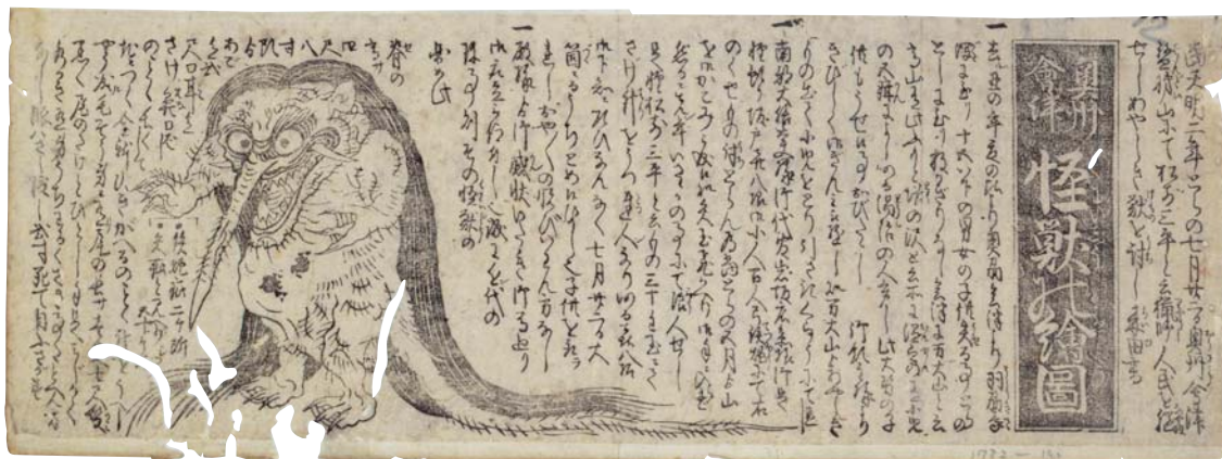
(右上)パン皮状火山弾 館蔵 約23万年前の噴火で火口から飛んだ火山弾。磐梯山の東南にある赤埴(あかほ)山の南麓で採取された。パンの皮に似てる？ (中上)法正尻遺跡出土硬玉製大珠 泉重文 福島県文化財センター-白河館蔵 磐梯山のふもと、猪苗代町と磐梯町にまたがる縄文時代の遺跡から発見されたヒスイの大珠。 (左上)蟹沢浜湖底遺跡 昭和20～30年頃の猪苗代湖の濁水期に、湖底から縄文時代の遺跡が現れた。 (下)奥州会津怪獣の絵図 個人蔵 天明2年(1782)頃のかわら版。版元不明。磐梯山に怪獣が現れ、獺師にしとめられたとある。宝の山のヌシ？