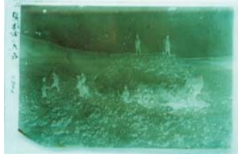
岩田善平撮影 写真原版

会 期 7月5日～11月16日 ※会期中は休館日なし 観 覧 料 大人 600円 中高校生 500円 小学生 400円 開館時間 8:00～17:00 問い合わせ 0241-32-2888