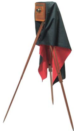
〔上〕東京朝日新聞社告・磐梯山噴火真図 山本芳翠画 館蔵 明治21年7月24日、噴火に関する詳細な図を近日発行する旨の予告が出され、山本芳翠による銅板画が8月1日に付録として配布された。画家による最新画像。 〔左中〕火山灰を被った杉枝 個人蔵 明治21年の噴火の火山灰が、生々しい。 〔右中〕日本製中型型銀板カメラ 日本カメラ博物館蔵 噴火報道のために訪れた記者たちは、このようなカメラをかついで取材をおこなった。 〔左下〕鳥瞰図の絵葉書 個人蔵 近代以降、磐梯山と猪苗代湖周辺の観光地化が進んだ。観光名所を紹介する絵葉書。

社告 磐梯山噴火に付ての同地罹災の實況を知らんが爲に、本館特派し電報を通じ、最速にその詳細なる報道を載せざる様手續をなしたれども、讀者をして尙一層の切に同地の實況を知り其慘狀を想せしめんせんに、精細なる眞圖を得るに在り、付今回風書を以て有名なる彼生巧館主山本芳翠氏を委託し親しく實地を就て其實況を撮影及び寫し極めて精細極めて確實ある一大真圖となし且同館の歐風彫刻家谷田清氏之が彫刻を請ひ附録として刊行する筈にて既山本氏より該地へ出張し目下その實景寫生中なれば近日を期して精密完全の一大真圖を完成し供するを待べし、其はくろ心を凝せられよ