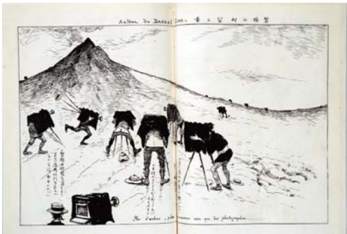
図3 図1 図2