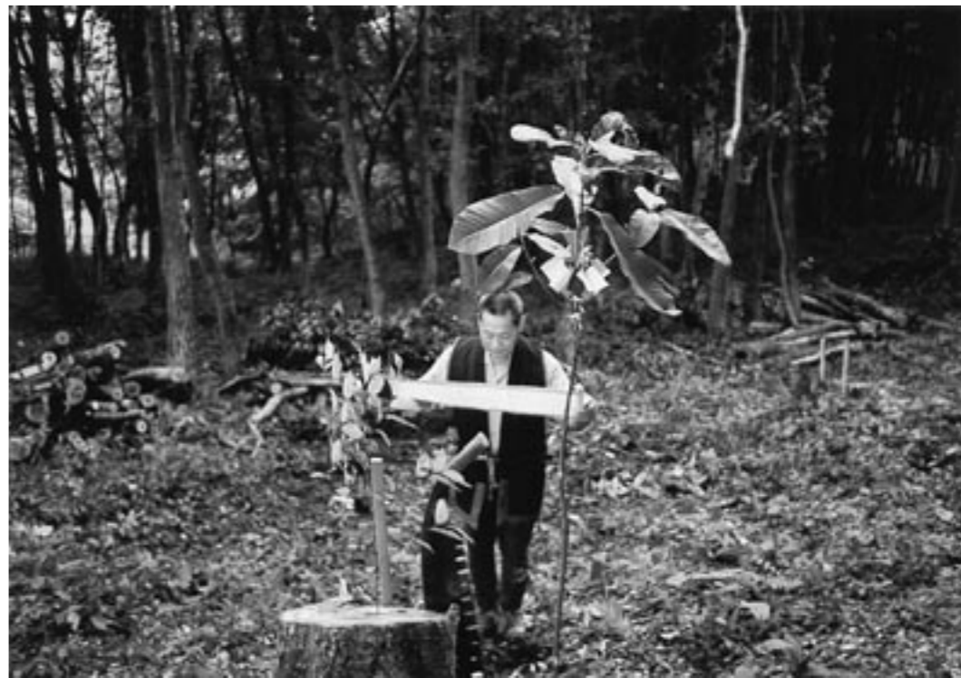
元山（伐採）の巻物 只見町 巻物をひろげ祝詞をあげ、山の神に感謝する