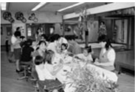
「はくぶつかんで遊ぼう！ 七夕かざりをつくらう」