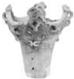
法正尻遺跡出土土器 福島県教育委員会蔵 (考古担当 高橋 満)

会津には重要な遺跡が多く、一度に紹介することが難しいため、主に縄文時代から弥生時代までの資料を「その一」として展示いたします。さらに今回はまほろん保管の県教育委員会発掘資料のほか、当館の所蔵資料、地元市町村による調査資料の出品も予定した「拡大版」を検討しています。ご期待ください。