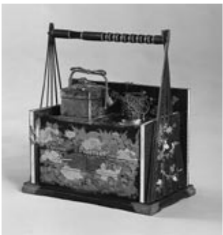
紫檀能尽蒔絵煙草盆（表）