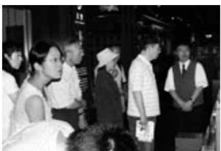
「やさしい展示解説会」