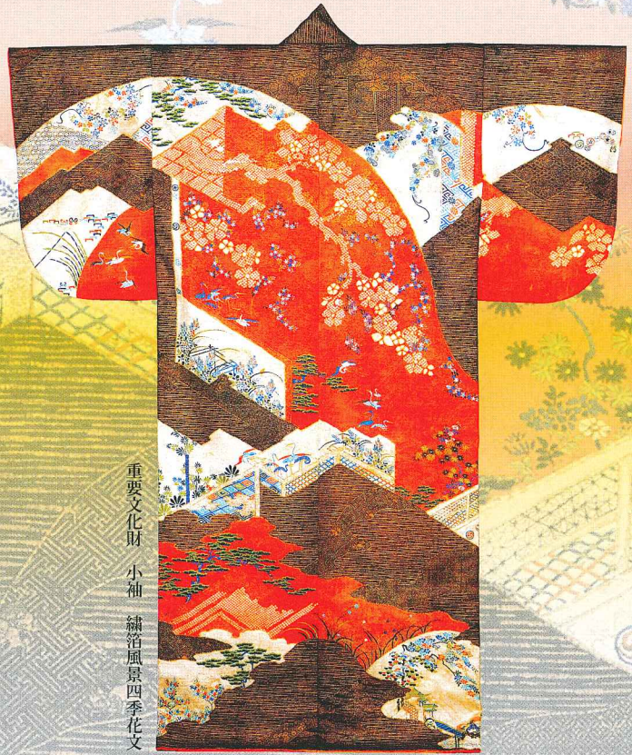
重要文化財 小袖 繡箔風景四季花文