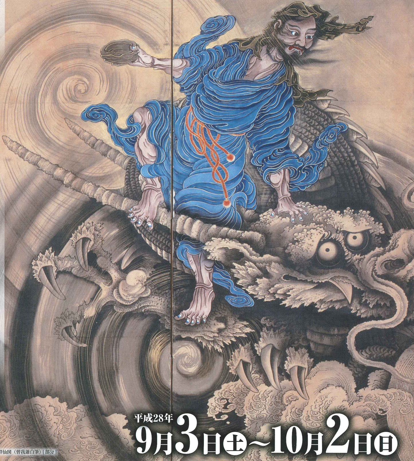
重要文化財 群仙図(曾我蕭白筆) [部分]