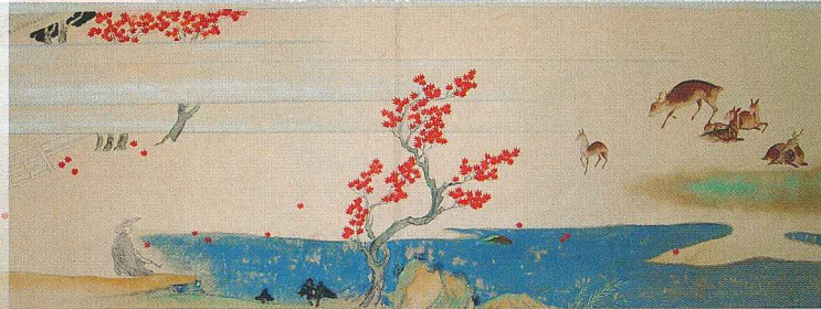
西行法師行状絵詞 卷三断簡(俵屋宗達筆)