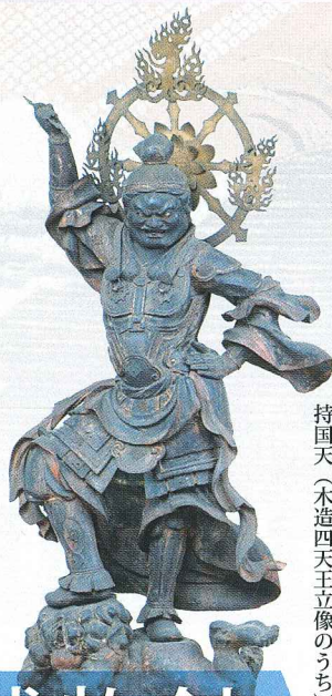
持国天(木造四天王立像のうち)