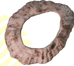
貝製の腕輪 茨城県広畑貝塚 縄文時代 江戸東京たてもの園