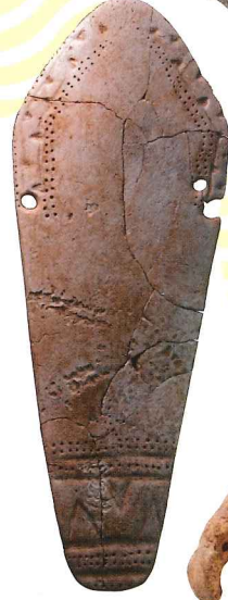
イルカの骨で作った腰飾り 千葉県有吉町遺跡 縄文時代 千葉県教育委員会