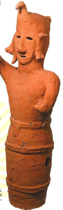
鳥を冠するはにわ人 埼玉県葛島古墳群 古墳時代 東松山市埋蔵文化財センター