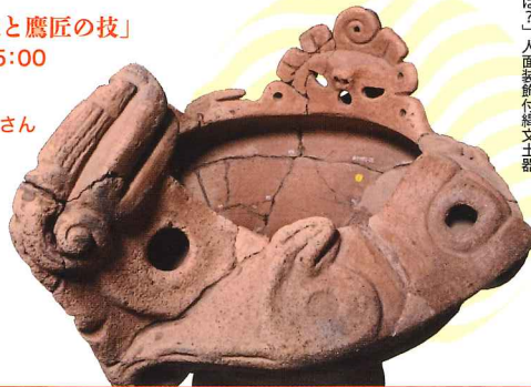
「へびが長つめるの先は？」 埼玉県西原大塚遺跡 志木市教育委員会