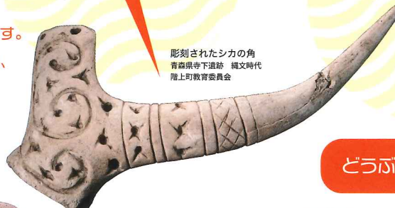
彫刻されたシカの角 青森県下道跡 縄文時代 階上町教育委員会