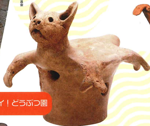
はにわのムササビ 千葉県南羽鳥正福寺遺跡 古墳時代 下総歴史民俗資料館