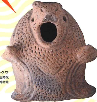
土器になったクマ 岩手県野原川遺跡 弥生時代 花巻市博物館